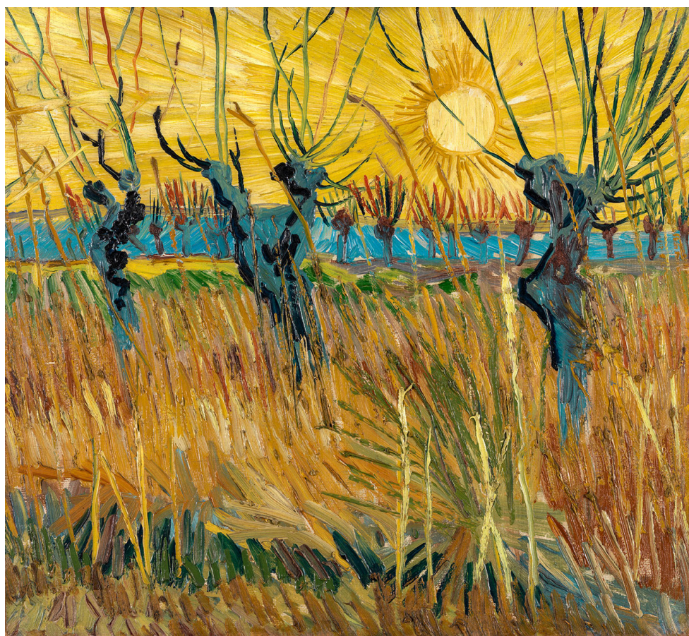
Vincent van Gogh, Stynede piletræer ved solnedgang , 1888. Coll. Kröller-Müller Museum, Otterlo