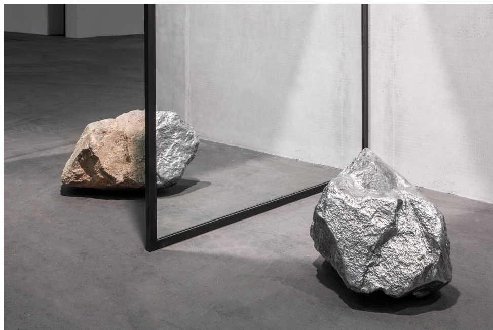
Alicja Kwade